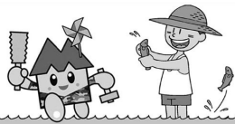
中央支部建勞くん