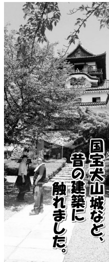
国宝大山城など、昔の建築に触れました。