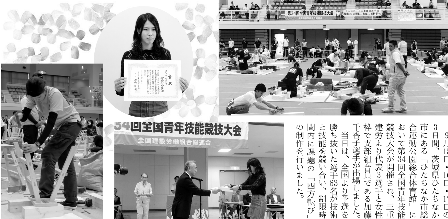
34回全国青年技能競技大会 全国建設労働組合総連合

津市久居緑が丘町一丁目5番地4 電話 (059) 252-2068 印刷所 三宅印刷(株)